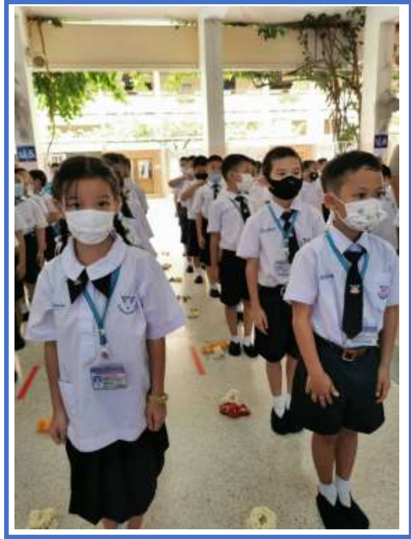
การเข้าแถวอย่างมีระเบียบ