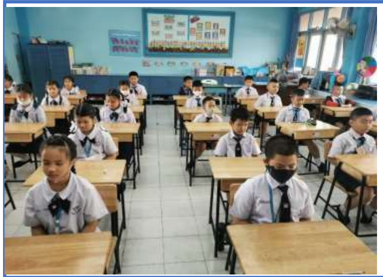
นักเรียนนั่งสมาธิก่อนการเรียน