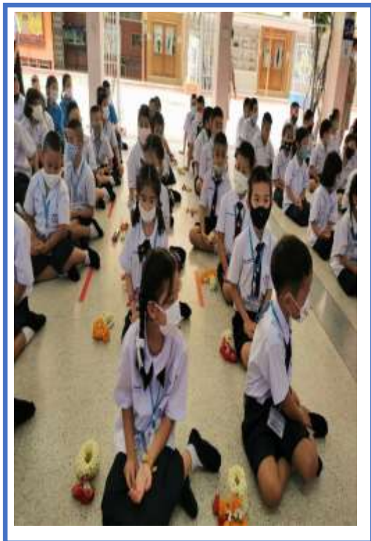
กิจกรรมวันไหว้ครู